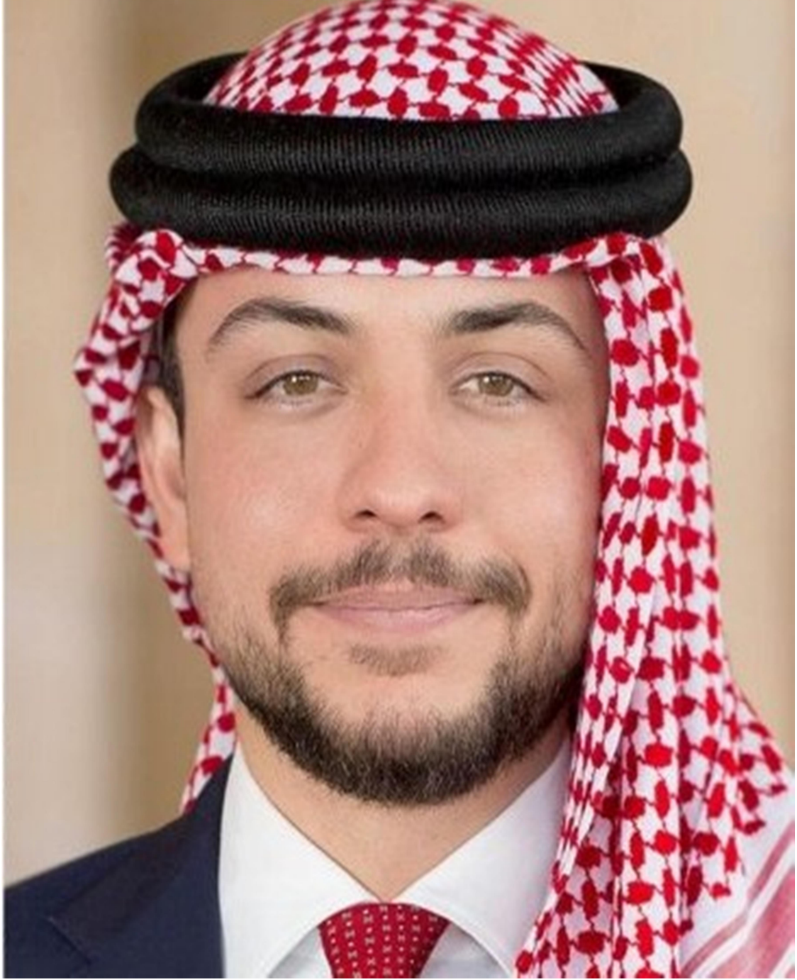
سمو ولي العهد الأمير الحسين بن عبدالله الثاني حفظه الله