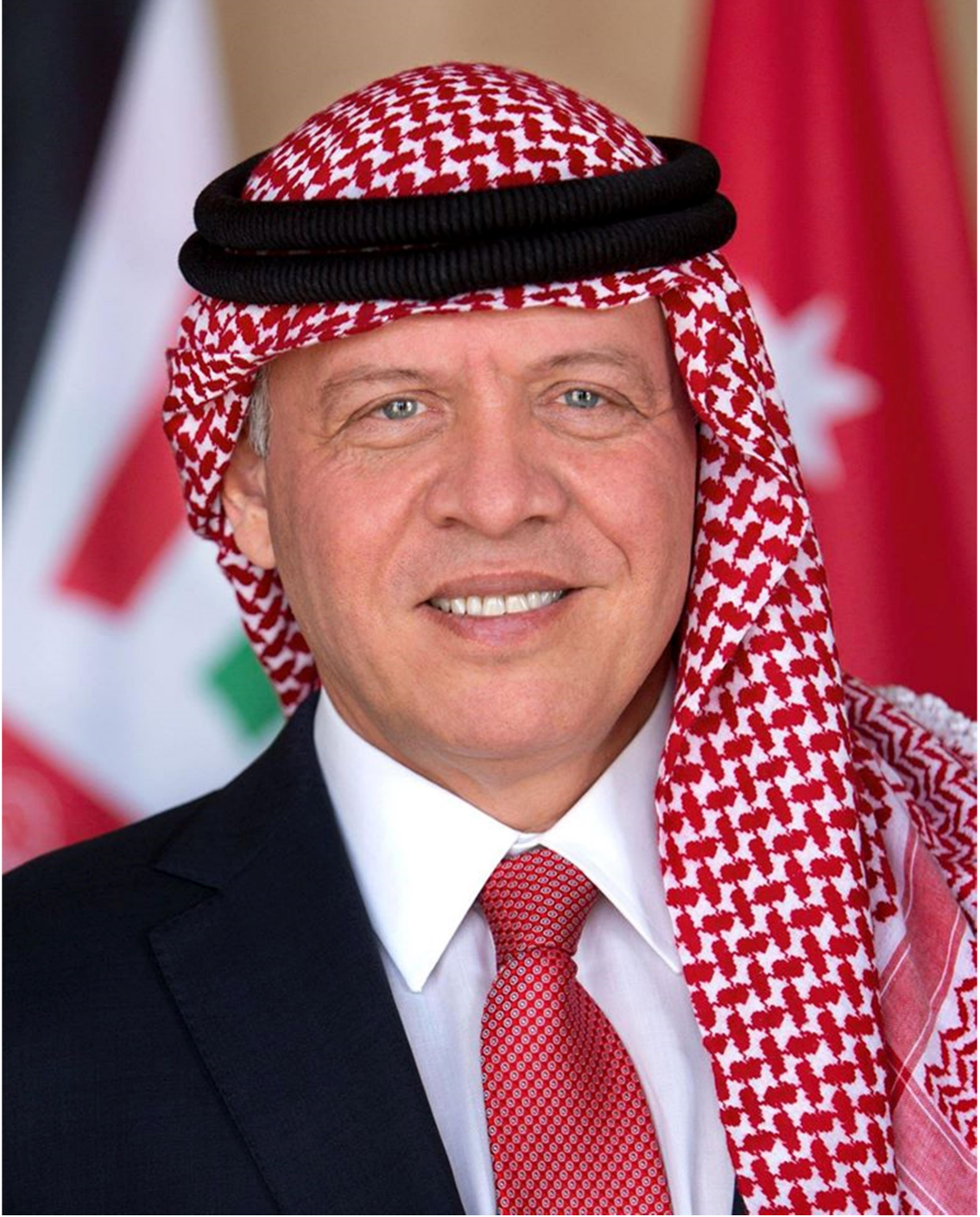
جلالة الملك عبدالله الثاني بن الحسين حفظه الله